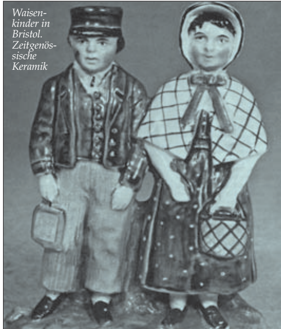
Waisenkinder in Bristol. Zeitgenössische Keramik