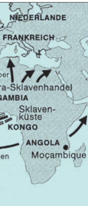
Der internationale Sklavenhandel zwischen Afrika, Europa und Amerika, durch Holländer, Franzosen, Briten, Portugiesen und Araber.

(zweiten) Ruf erfüllt, als Antwort auf Gottes (ersten) Ruf. Für Luther kann der Landarbeiter und der Händler - für uns der Geschäftsmann, der Lehrer, der Fabrikarbeiter und der Fernsehmoderator - das Werk Gottes genauso gut oder schlecht tun wie der Geistliche und der Missionar. Für ihn und die nachfolgenden Reformatoren war die Wiederentdeckung des ganzheitlichen Verständnisses der Berufung ein einschneidendes Erlebnis. Mit seiner Schrift „Über den Ehestand“ im Jahre 1522 erklärte Luther, dass Gott und die Engel lächeln, wenn ein Mann eine Windel wechselt. William Tyndale schrieb, dass wenn wir Gott gefallen wollen, „es alles eins ist“, ob wir Wasser ausgießen, das Geschirr waschen, Schuhe besohlen oder das Wort Gottes predigen. William Perkins behauptete, dass Schuhe zu putzen ein geheiligter und heiliger Akt sei.