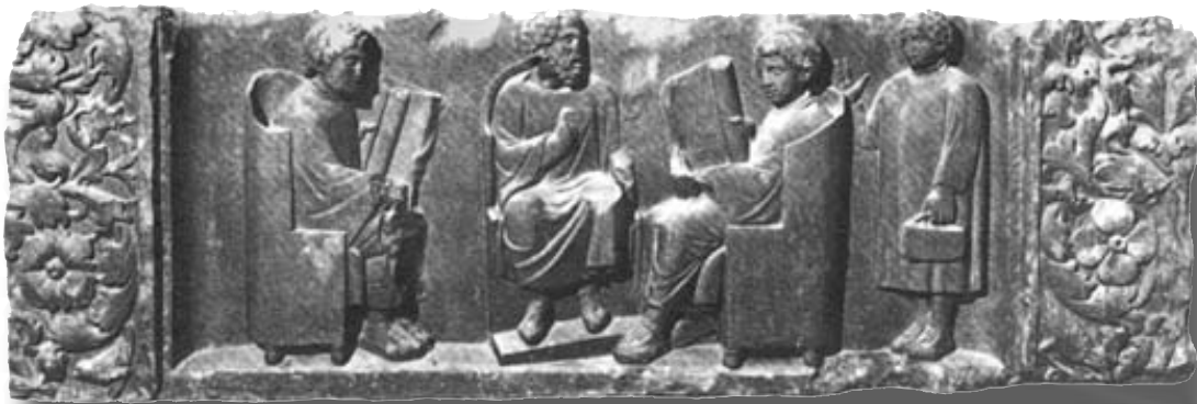
Lehrer und Schüler z.Zt. des Neuen Testaments. Römische Relief

Wir können heute nicht mehr davon ausgehen, dass das, was immer galt, kritiklos übernommen wird. Man erwartet heute mehr denn je, dass Lehrauffassungen sorg-