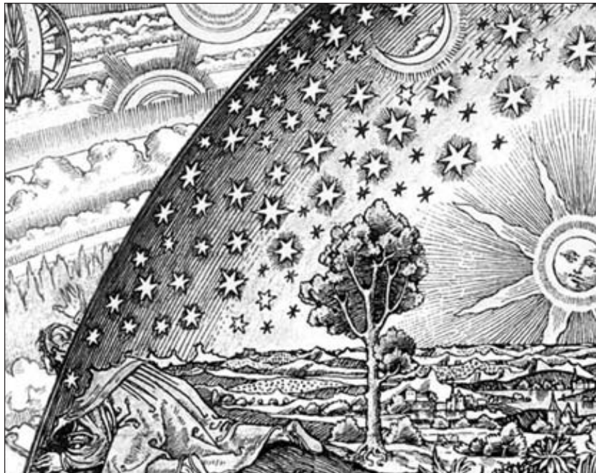
Kopernikus hinterfragte die Lehre des zeitgenössischen Weltbildes, das man mit vorgefaster Auffassung in die Aussagen der Bibel hineingelesen hatte.

Winde der falschen Lehre stießen schon immer gegen das Haus der Gemeinde (Matthäus 7,25.27). Diese Winde werden auf das Ende hin heftiger werden. Auf das Ende nehmen die Irrlehren zu und werden die falschen Prophe-