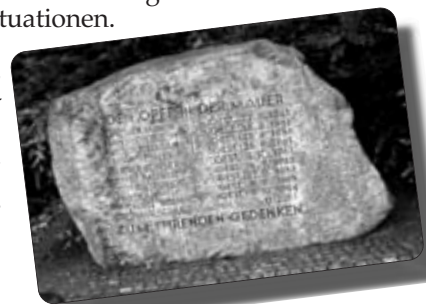
rechts: Gedenkstein an der Bernauer Straße, Berlin, zum Gedenken an die Opfer des Mauerbaus.

Zivilcourage - ungewöhnliches Tun gewöhnlicher Menschen in außergewöhnlichen Situationen.