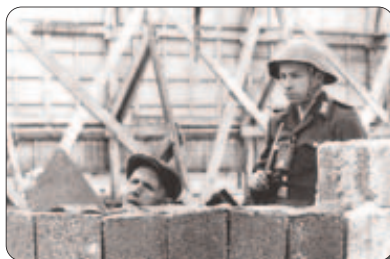
oben: Mauerbau 13. August 1961. rechts: Mauer-Öffnung 11.11.1989.

Sie vergleichen untereinander ihre Ergebnisse mit den veröffentlichten. Sie verbreiten ihre Kennt-