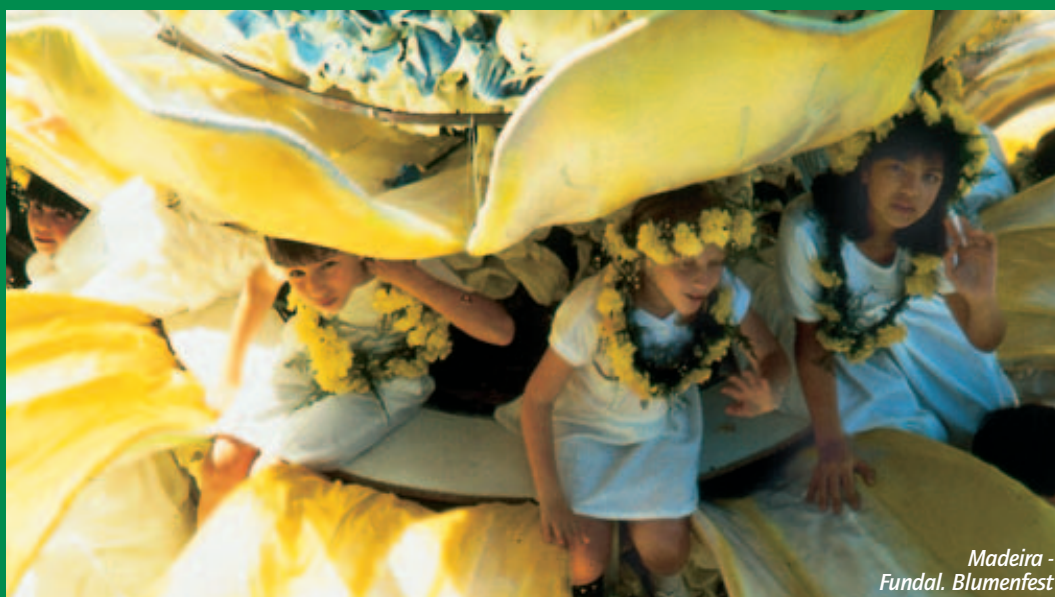
Madeira - Funchal. Blumenfest