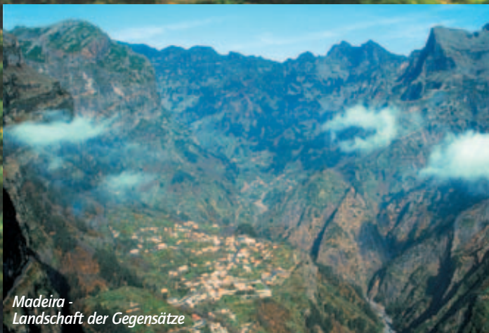
Madeira - Landschaft der Gegensätze