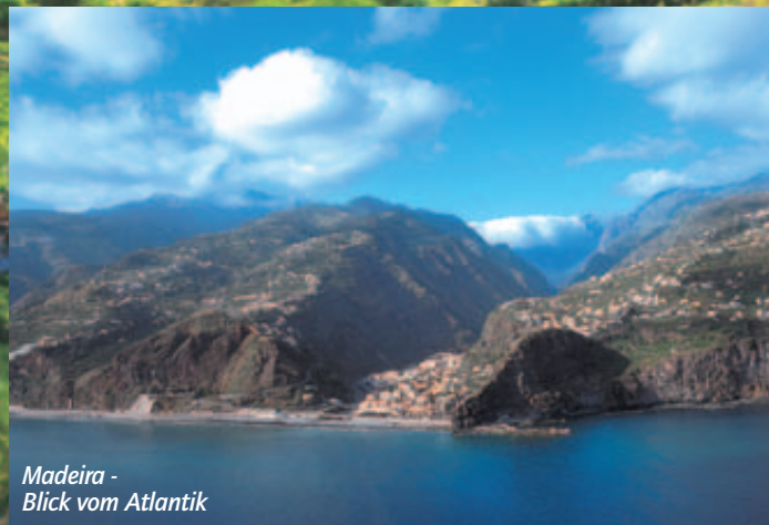
Madeira - Blick vom Atlantik