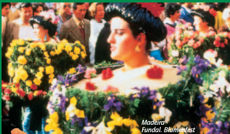
Madeira - Funchal. Blumenfest