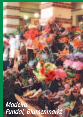
Madeira - Fundal, Blumenmarkt