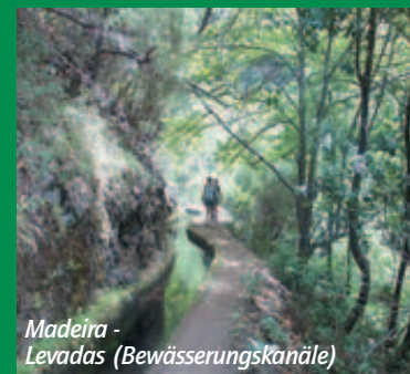
Madeira - Levadas (Bewässerungskanäle)