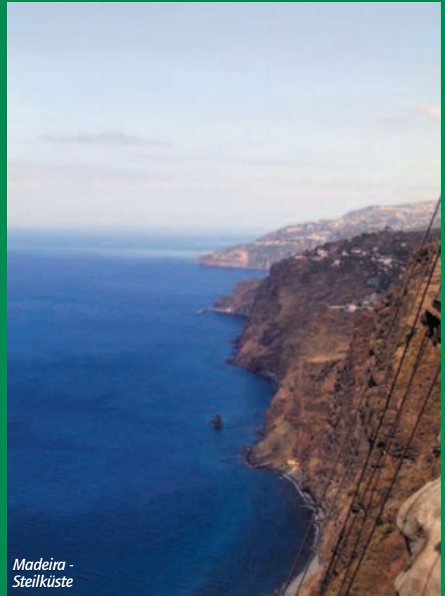
Madiera - Steilküste