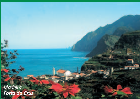
Madeira - Porta da Cruz