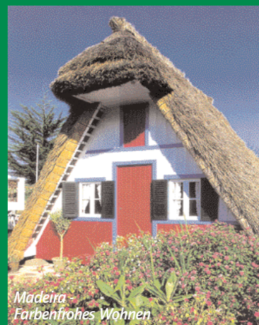
Madeira - Farbenfrohes Wohnen

Wir danken dem portugiesischen Touristikbüro für die Unterstützung durch Fotos und Informationen.