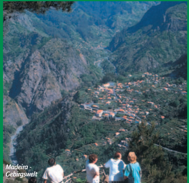
Madiera - Gebirgswelt

Das Image der Insel vom „ewigen Frühling“ verrät einiges über das Klima. Die Durchschnittstemperaturen in Funchal schwanken über das Jahr zwischen 18°C und 25°C. Die Meerestemperaturen pendeln zwischen 15°C im Winter und 23°C im Hochsommer.