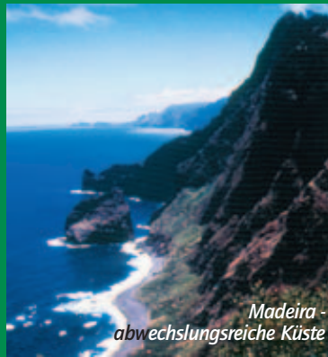
Madiera - abwechslungsreiche Küste