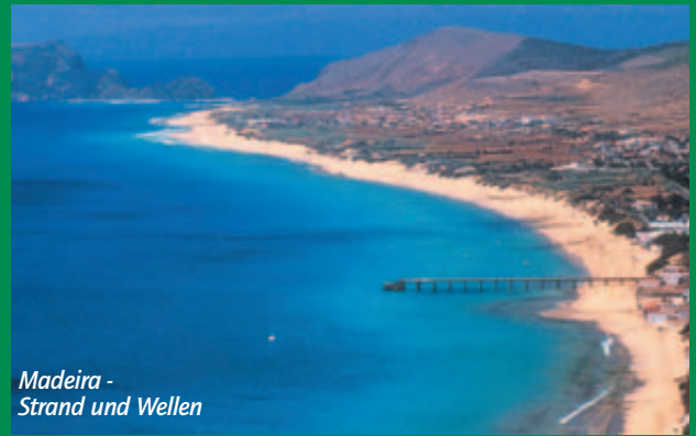
Madiera - Strand und Wellen