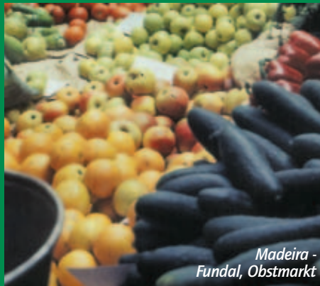
Madeira - Fundal, Obstmarkt