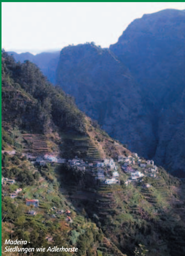
Madeira - Siedlungen wie Adlerhorste