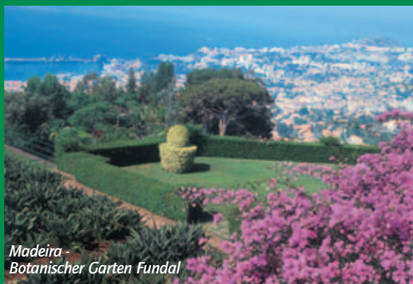
Madeira - Botanischer Garten Fundal