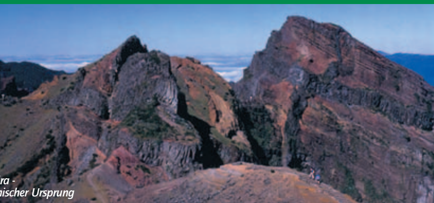
Madiera - vulkanischer Ursprung