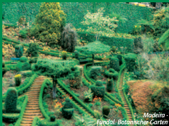
Madeira - Funchal. Botanischer Garten