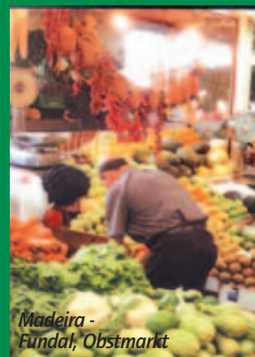
Madeira - Fundal, Obstmarkt