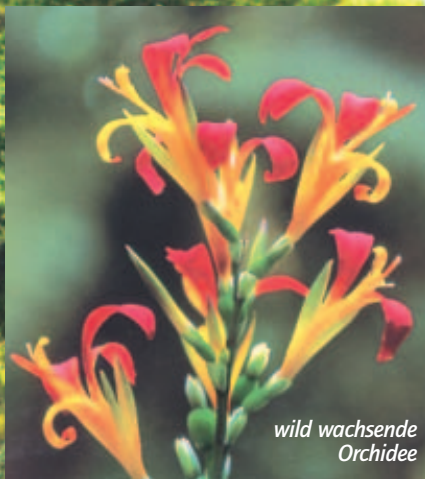
wild wachsende Orchidee