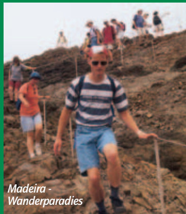
Madiera - Wanderparadies