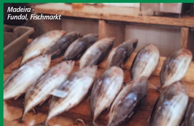
Madeira - Fundal, Fischmarkt