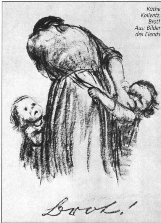
Käthe Kollwitz. Brot! Aus: Bilder des Elends

Sehen wir unser Geld, das wir für Gott säen, als einen Verlust, als „weggeworfen“ an? Oder glauben wir seinen Verheißungen, dass gerade dieses Geld die besten „Zinsen“ bringt? Und vertrauen wir, dass man durch Geben nicht ärmer wird, sondern im Gegenteil reicher? Paulus stellt