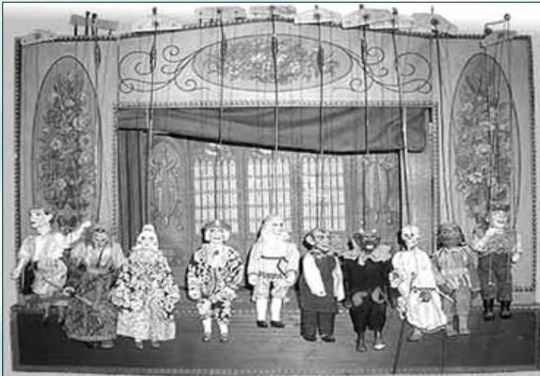
Gemeinde - ein Marionettentheater, bei dem einige wenige eine straff geführte Regie führen?

V or Jahren hatten wir für einige Tage Besuch von Verwandten aus Kanada. Sie gehörten dort einer straffen kirchlichen Organisation an, gingen aber hier bei uns am Sonntag mit zur Gemeinde. Anschließend musste ich mir von unserem Gast jedoch einige Fragen gefallen lassen: „Habt ihr tatsächlich keinen Pastor, der die Gemeinde und die Zusammenkünfte leitet? Kommt ihr einfach ohne ein vorher festgelegtes Programm zusammen, ohne eine Liturgie? Kann sich bei euch ohne weiteres jeder beteiligen, wie es ihm gerade in den Sinn kommt? Geht es bei euren Zusammenkünften dadurch nicht manchmal chaotisch zu?“