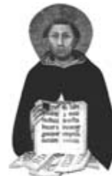
o.: Immanuel Kant (1724-1804), u.: Thomas von Aquin (1225-1274)

bleibt, wie groß dieser erste Bewegener ist. Er muss nämlich nicht automatisch allmächtig sein.