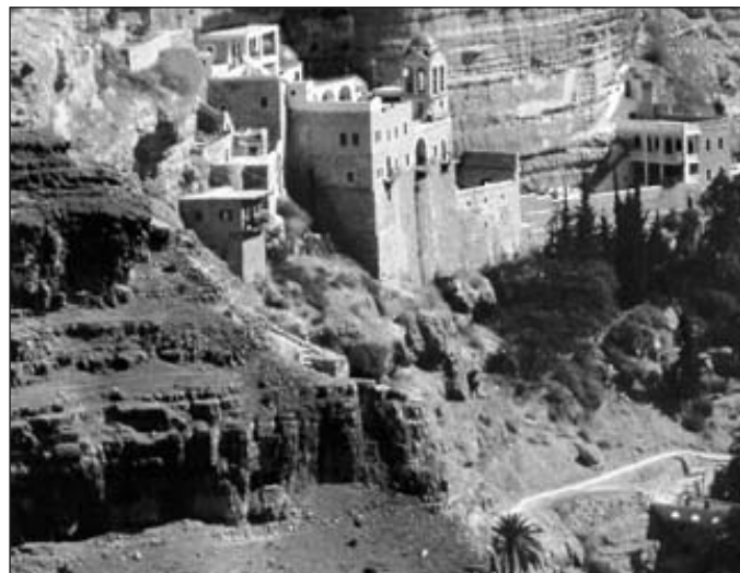
Abb. oben: Wadi Quelt, der Weg von Jerusalem nach Jericho

Als nächstes kam ein Levit vorbei. Auch die normalen Leviten, die nicht zur Priesterkaste gehörten, standen in der religiösen Hierarchie weit oben. Levi war der Stamm Is-