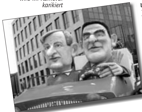
Die Obrigkeit wird im Karneval karnikiert

und andere Prominente werden gleichermaßen und ohne Maß durch den Kakao gezogen