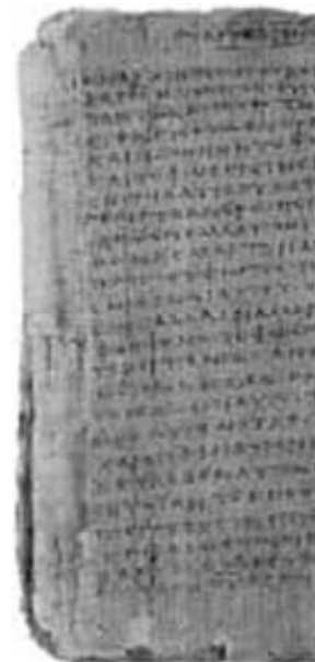
Älteste Handschrift des Johannes-Evangeliums aus dem 2. Jh.n.Chr.