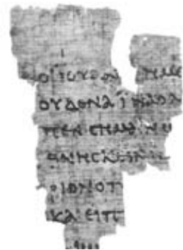
Der sogenannte Papyrus P52. Auszüge aus Johannes 18. 125 n.Chr.

4. Ungeachtet der ausführlicheren Darstellung weist das Johannes-Evangelium einen weniger umfangreichen Wortschatz als die verbleibenden Evangelien auf. Zu beachten sind dabei jedoch etliche Begriffe, die eine besondere Rolle spielen. Zu diesen Wörtern gehören u.a.: Vater, Sohn, Leben, erkennen/wissen, Licht, Finsternis, glauben, etc.