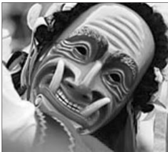
Fastnachtfigur Federhannes aus Rottweil

B is heute gehen die Meinungen über die Herkunft des Karnevals auseinander. Für die einen liegt der Beginn des närrischen Treibens im 12. Jahrhundert, da die Fastnacht hier zum ersten Mal nachweislich dokumentiert wurde. Vertreter dieser Sicht sehen den Karneval daher als ein dem christlichen Jahresablauf entsprungenes Fest. Dabei wird Fasching als die unmittelbare Zeit vor dem Beginn der katholischen Fastenperiode interpretiert. Ursprünglich ging es zuerst nur um den Dienstag mit seiner letzten Nacht vor der 40-tägigen Fastenzeit bis Ostern (Fastnacht - Nacht vor dem Fasten). Ehe die magere und düstere Zeit der Entsagungen anbrach, durften körperliche Bedürfnisse und Begehlichkeiten ein letztes Mal exzessiv ausgelebt werden. Angesichts der baldigen Beschränkungen bot sich hier so etwas wie die finale Gelegenheit, „das Leben noch einmal in seinen vollsten Zügen zu genießen.“ (1) Nachdem man sich „für die kommende Askese vorweg entschädigt“ (2) hatte, begann die Durststrecke der Restriktionen beim Essen und Trinken und der sexuellen Enthaltsamkeit.