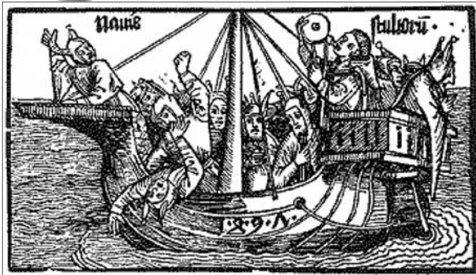
Narrenschiff. Mittelalterlicher Holzschnitt.

Ausgelassenheit unter Aufhebung aller konventionellen Regeln und Moralvorstellungen. Er ist infolgedessen in seiner Prägung gottlos, also im wahrsten Sinne des Wortes los von Gott. Ein unbedarftes Mitmachen käme einem (wenn auch unbewussten) Kniefall vor dem Engel des Lichts als dem Fürsten der Finsternis und einem Rückfall in heidnische Gepflogenheiten gleich. Deshalb bleibt es bei der paulinischen Aufforderung an die Römer: „Lasst uns anständig wandeln wie am Tag; nicht in Schwelgereien und Trinkgelagen, nicht in Unzucht und Ausschweifungen“ (Römer 13,13), selbst, wenn es unsere Nachbarn, Mitschüler und Arbeitskollegen „befremdet, dass wir nicht mitlaufen in demselben Strom der Heillosigkeit“ (1. Petrus 4,4).