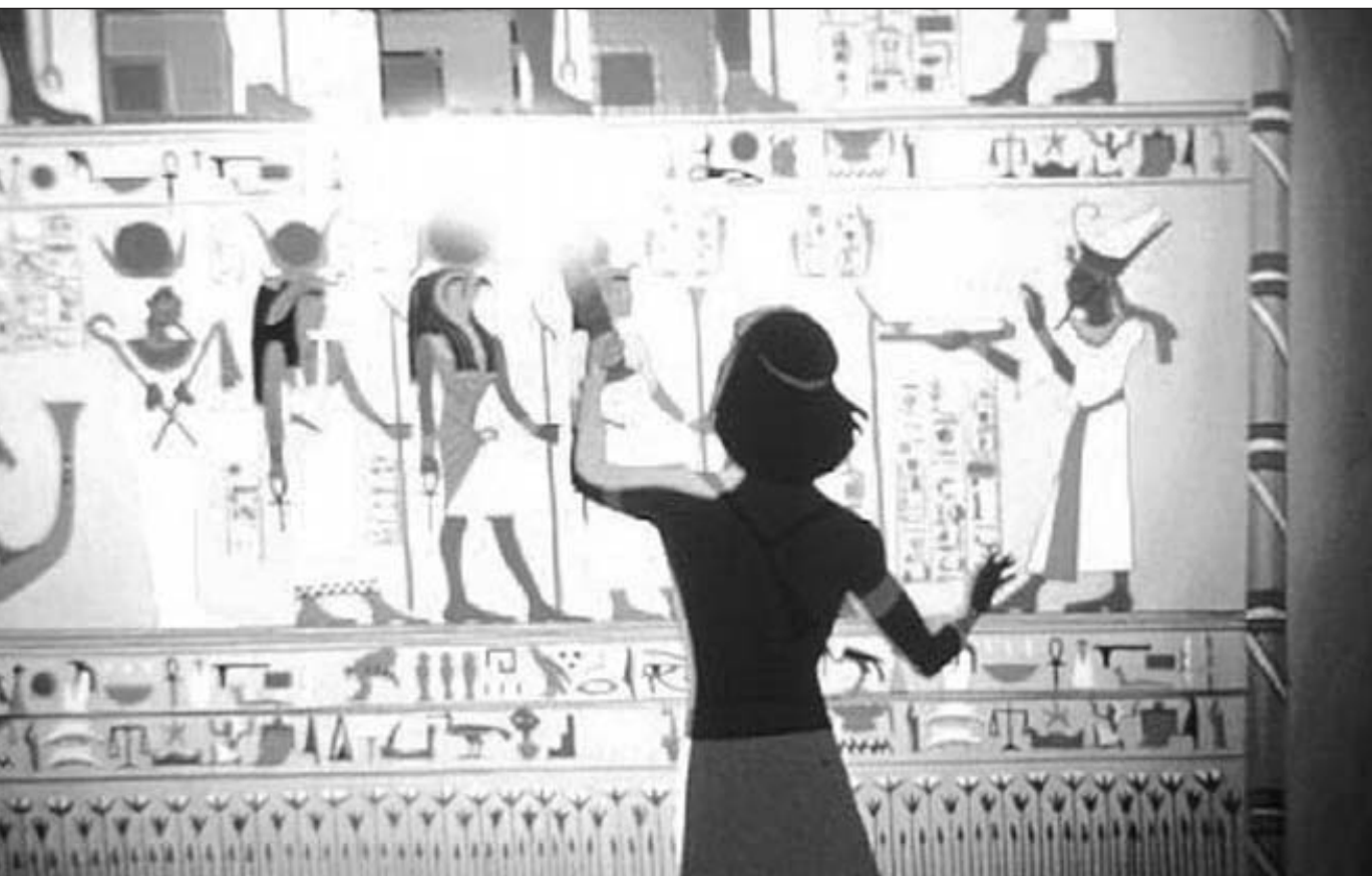
Mose vor ägyptischen Hieroglyphen. Szene aus dem Film „Prince of Egypt“.

sprach damals zu Mose und vor 2000 Jahren zu uns, niedergeschrieben in Matthäus 28,20: „Siehe, ich bin bei euch alle Tage bis zur Vollendung des Zeitalters.“