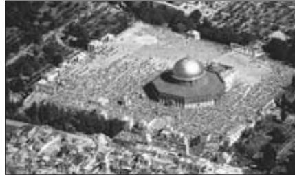
Freitagsgebet in Jerusalem, Tempelberg