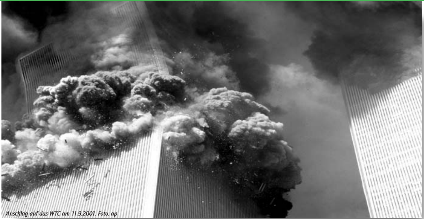
Anschlag auf das WTC am 11.9.2001.

und Laodizea? Solche Vorstellungen machen Angst.