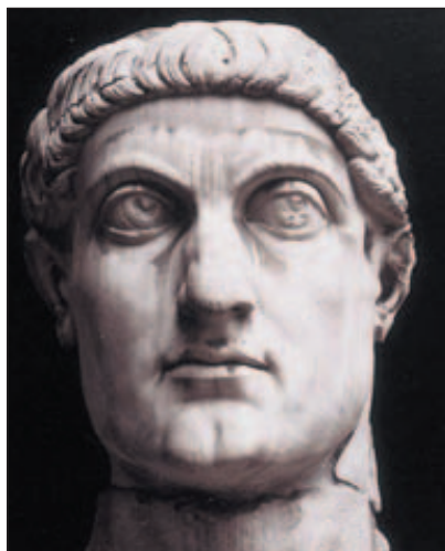
Unten: Kaiser Konstantin. Daneben: Konzil zu Nicäa. Ganz rechts: Nathan Söderblom