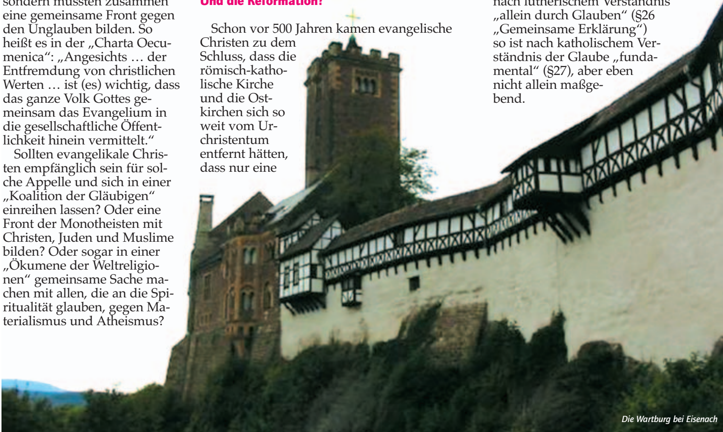
Die Wartburg bei Eisenach

Nimmt man die „Gemeinsame Erklärung“ unter die Lupe, so wird deutlich, dass auch die unterschiedlichen Auffassungen zur Rechtfertigung durch den Glauben keineswegs ausgeräumt sind. Rechtfertigt Gott den Sünder nach lutherischem Verständnis „allein durch Glauben“ (§26 „Gemeinsame Erklärung“) so ist nach katholischem Verständnis der Glaube „fundamental“ (§27), aber eben nicht allein maßgebend.