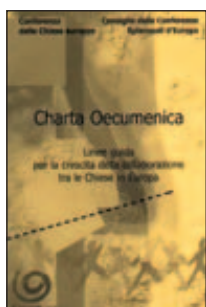
Die „Charta Oecumenica“, 2001