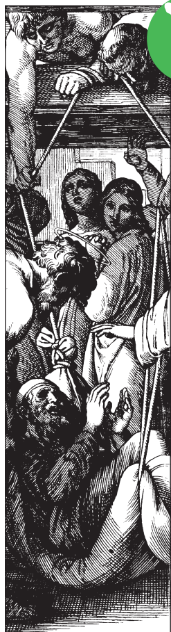
Jesus heilt den Gichtbrüchigen. Schnorr von Carolsfeld, 1860

V oller Freude tragen vier Männer ihren kranken Freund zum Haus, wo Jesus Christus sich aufhält. Sie wissen, der Messias kann helfen. Sie wissen es nicht nur, sondern sie glauben es ohne jede Einschränkung.