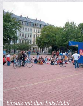
Einsatz mit dem Kids-Mobil