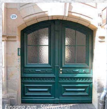
Eingang zum „Stoffwechsel“