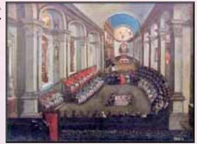
Konzil zu Trient 1512-1517

„ordentliche Lehramt“ wahr, wenn sie auch nicht unfehlbar sind und nur im Rahmen der päpstlichen Lehrentscheidung die „Wahrheit“ der Kirche verkünden können.