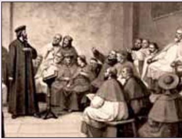
Johannes Hus vor dem Kon- stanzer Konzil 1414-1418

durch feierliches Urteil gelehrt worden ist.“