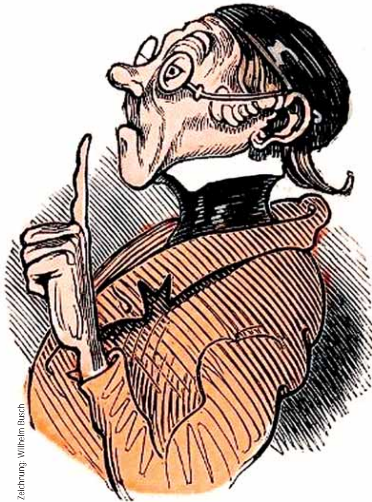
Zeichnung: Wilhelm Busch

vor? Es geht nicht nur um eine schöne Wohnung, Bett und Auto! Es geht um das geistliche Wohl und Glück deiner Frau!