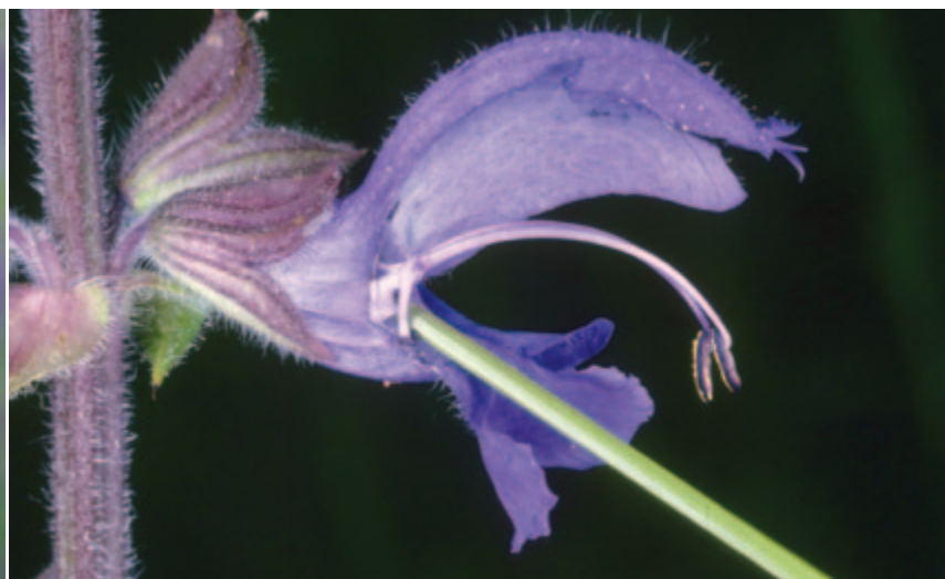
Abb. 4: Den Schlagbaummechanismus kann man auch mit einem Grashalm auslösen.