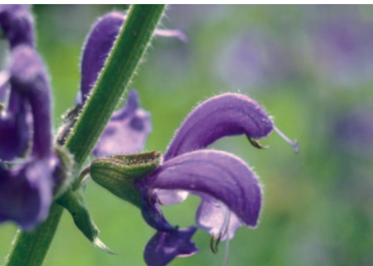
Abb. 3: Der Griffel ist lasch geworden und hängt wie ein Vorhang vor dem Blüteneingang.

Zum anderen die Wiederverwendung von ähnlichen Bauteilen in ganz