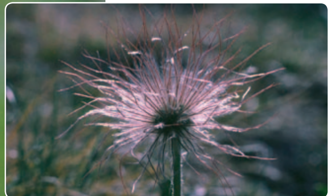
Abb. 5 und 6: Als Federschweif ausgebildete Griffel bei der Berg-Nelkenwurz (oben) und bei der Küchenschelle (rechts).