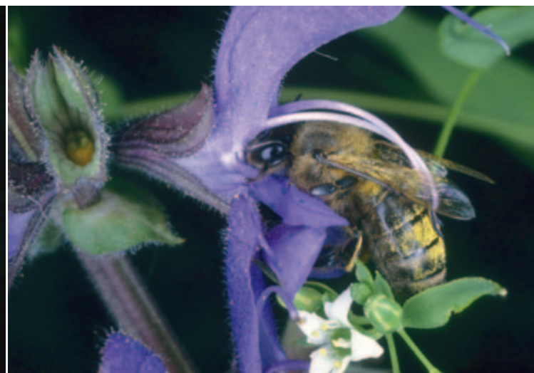
Abb. 2: Es klappt! Die Biene hat den Schlagbaum heruntergedrückt und der gelbliche Pollen klebt auf dem Rücken des Insekts.