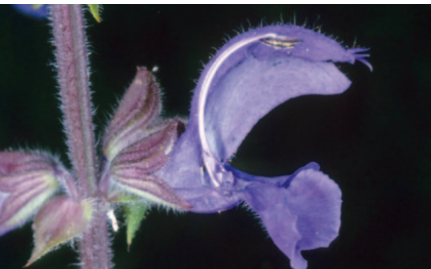
Abb. 1: Merkwürdige „Innereien“ der Salbei-Blüte

Die Geschichte ist damit noch nicht zu Ende, denn der Pollen muss nicht nur abgeholt, sondern auch wieder an der richtigen Stelle abgegeben werden: am oberen Ende des Blütengriffels einer anderen Pflanze. Das kann erst geschehen, wenn das Insekt eine ältere Blüte besucht. Denn nach einigen Tagen der Blühzeit wird zunächst nur der Griffel lasch, er hängt aus dem „Helm“ heraus und versperrt dadurch den Zugang zur Blüte. Die Biene streift beim Landen den Griffel mit ihrem Rücken, dabei wird der mitgebrachte Pollen auf die Narbe (Spitze des Griffels) übertragen - er ist angekommen und es kann eine Befruchtung stattfinden.