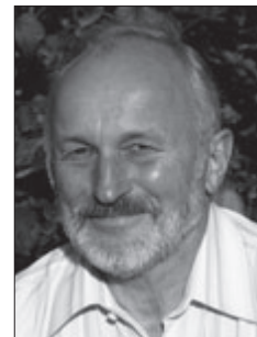
:P Joachim Deschner „Hoffnung für Familien“ e. V., www.hoffnung-fuer-familien.de